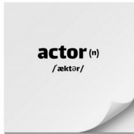
جلوی فلش کارت

مثلا می خواهیم کلمه ی actor را روی فلش کارت بنویسیم. یک طرف، خود کلمه با تلفظ را می نویسیم.